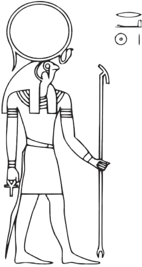
Fig. 1 - Horus.

All'inizio, l'immortalità era riservata solo al faraone, che ne aveva diritto essendo l'incarnazione del neter Horus, raffigurato come un falco o come un uomo con la testa di falco. Con il passare del tempo e il succedersi delle dinastie, l'immortalità si estese a chi se la poteva permettere e naturalmente a chi conosceva e praticava tutti i riti e le formule magiche che la garantivano: i sommi sacerdoti, che non erano unicamente ministri di culto, ma rappresentavano la classe iniziatica ed erano i veri detentori delle conoscenze esoteriche.